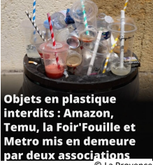
Objets en plastique interdits : Amazon, Temu, la Foir'Fouille et Metro mis en demeure par deux associations

Malgré l'interdiction depuis 2020, France Nature Environnement et Surfrider ont retrouvé des produits en plastique jetable encore en vente. Amazon, Temu, Metro, La Foir'Fouille et La Boutique du jetable ont été mis en demeure de les retirer sous 3 mois.