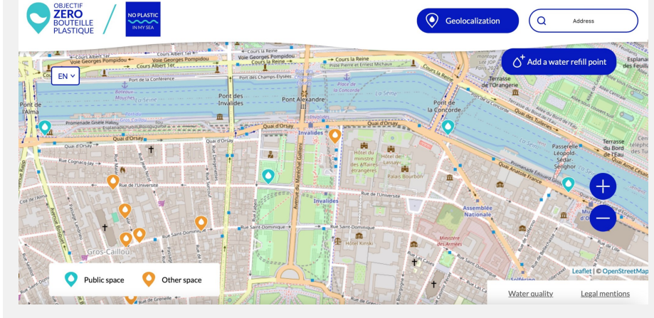
Exemple de résultats de la carte des points d'eau (en anglais) dans le coeur de Paris à proximité de futurs sites des JO

→ des ressources (signalétique, qualité de l'eau ...) disponibles pour accompagner les acteurs et répondre aux interrogations légitimes.